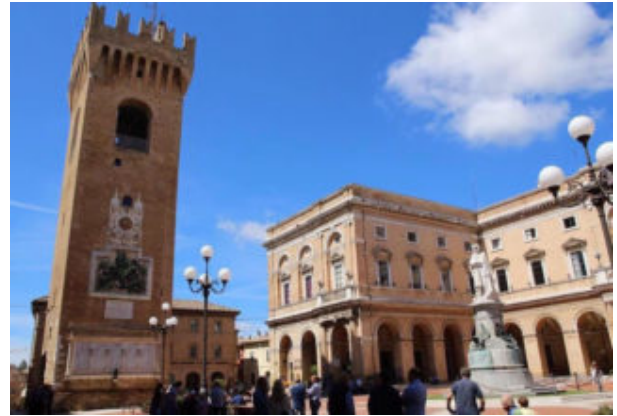
Recanati – scorcio di piazza Leopardi