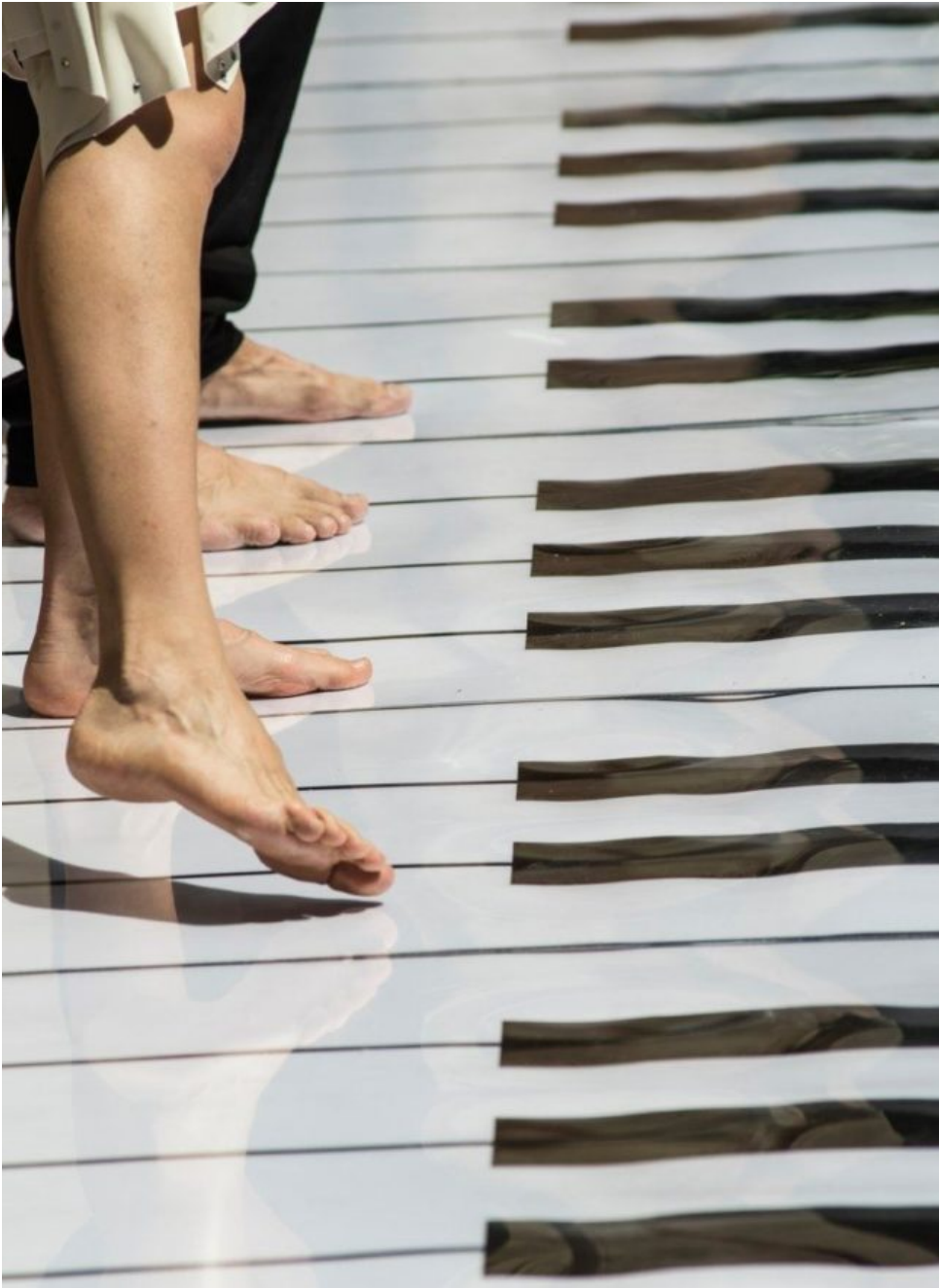
Veregra Street Festival – il grande piano

Tra il 28 e il 30 giugno 2018 si svolge la seconda parte del XX Veregra Street Festival, una delle più grandi ed importanti kermesse italiane di arte di strada che porta nel centro storico di Montegranaro la magia, la meraviglia e il divertimento delle arti di strada con tantissimi spettacoli e artisti provenienti da molte parti del mondo , la grande novità del Veregra Market in vicoli e piazzette del borgo storico con aziende d'eccellenza nel panorama agroalimentare e dell'artigianato artistico del territorio