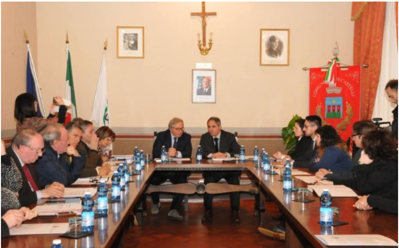
26_01_2015_Giunta Regionale a Trecastelli

segnaletica stradale e autostradale per garantire visibilità al nuovo Comune, la priorità di accesso nei bandi e la garanzia del mantenimento del contributo decennale regionale e delle altre agevolazioni previste dall'istituzione del nuovo Comune. All'incontro ha partecipato anche il presidente della IV Commissione consiliare permanente dell'Assemblea legislativa, Enzo Giancarli. È terminato con la visita al Museo cittadino "Nori De' Nobili, Centro studi sulla donna nelle Arti visive contemporanee".