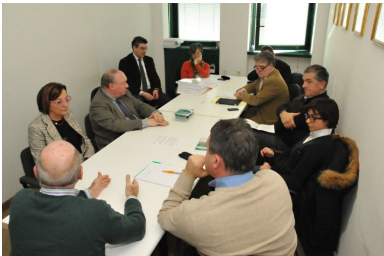
un momento dell'incontro

assessori hanno ricevuto anche una delegazione di lavoratori per illustrare direttamente le soluzioni condivise con il commissario e i sindacati.