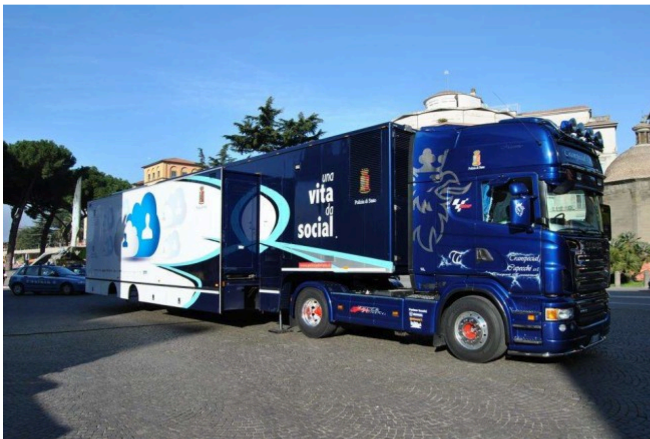
Una vita da social

Polizia scientifica e della Polizia stradale nonché unità cinofile antidroga. Quella di Giulianova è l'unica tappa per la provincia di Teramo di "Una vita da social".