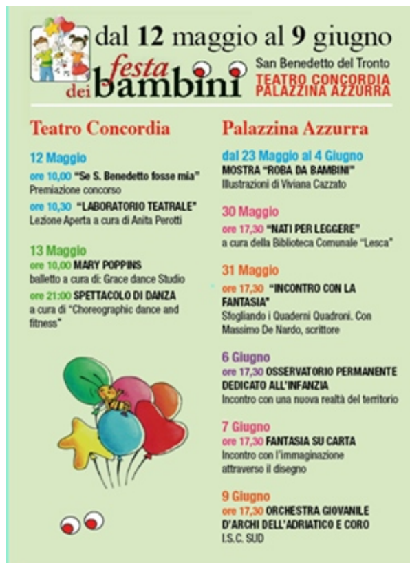
Festa dei Bambini