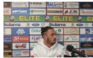
Palumbo © www.ilmascalzone. it