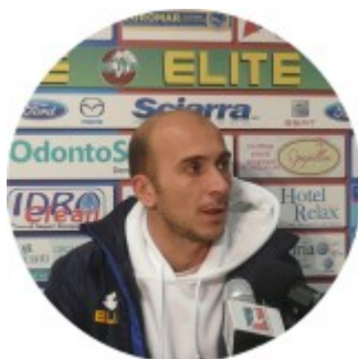
Sabatino © www.ilmascalzone. it