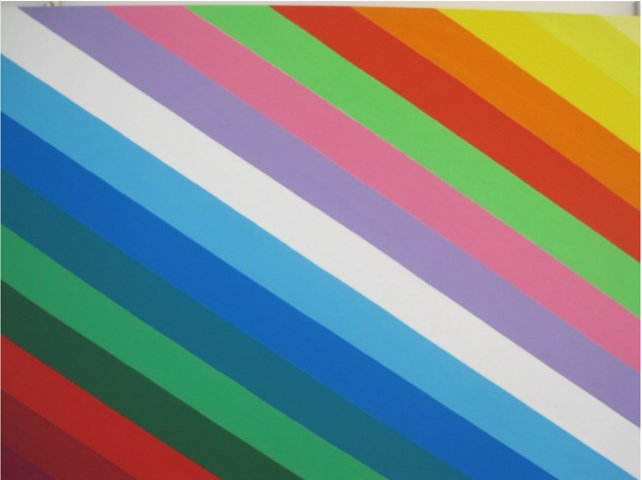
Nicola Rosetti, "Poesia dell'azzurro"