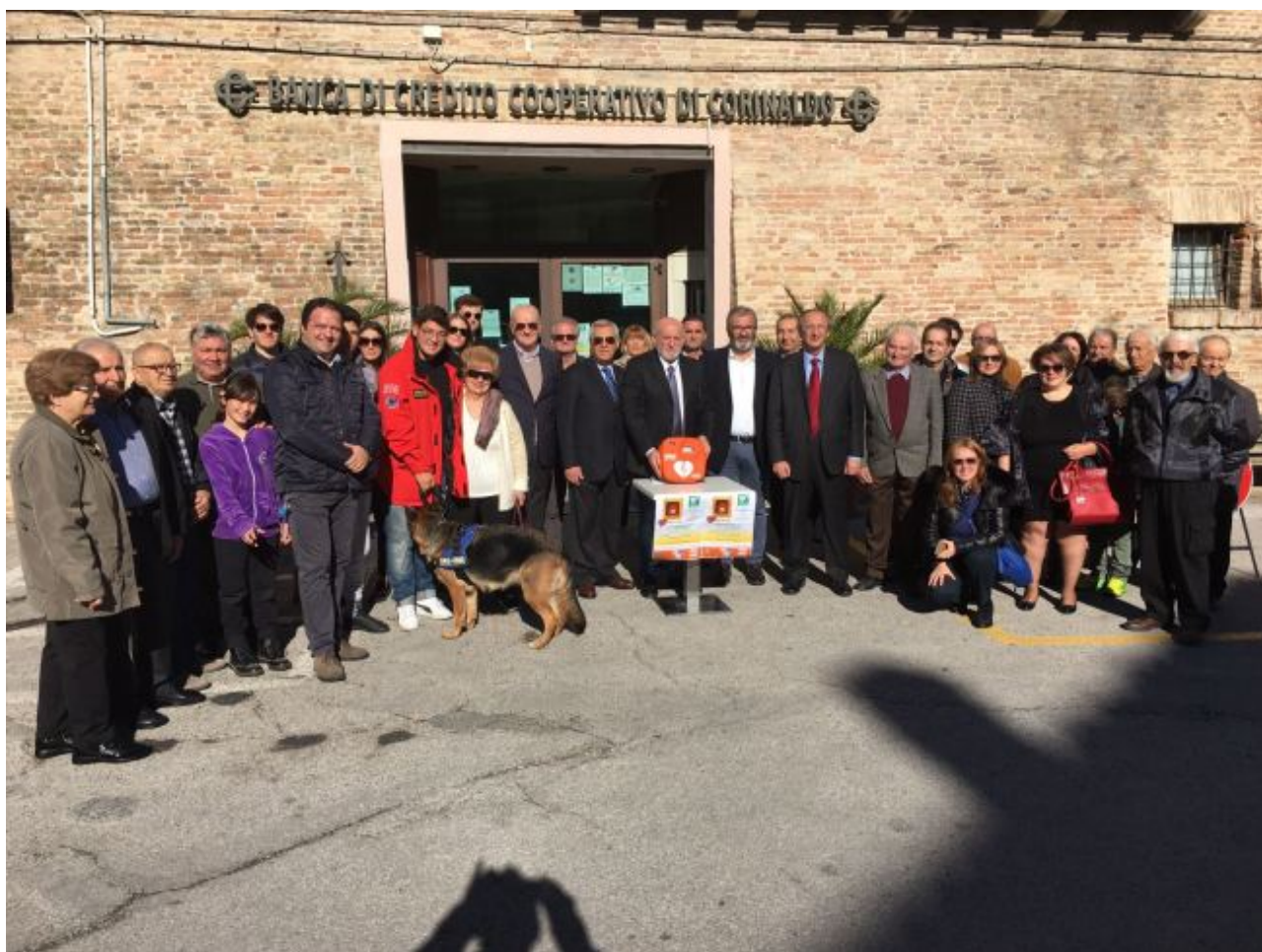
Defibrillatore in piazza a Castelleone

Garantiscono la formazione in tutta Italia grazie alla rete di Medici e Istruttori accreditati nelle varie C.O. 118 di competenza. I corsi di rianimazione rispettano le nuove linee guida internazionali ILCOR 2015 (International Liaison Committee on Resuscitation) ed in particolare i manuali di rianimazione fanno riferimento alle raccomandazioni dell'organismo medico internazionale AHA (American Heart Association).