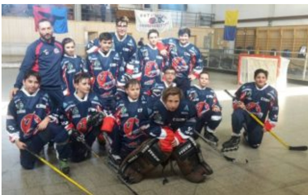
Samb Hockey inline

Infine una nota di colore: il seppure sparuto gruppo di tifosi che ha seguito la squadra ha costantemente inscenato un tifo assolutamente sportivo ma particolarmente pittoresco e chiassoso. Una vera e propria "torcida" che ha incitato i giocatori e nel contempo ha ricevuto l'approvazione e la simpatia dell'intero pattinodromo romagnolo.