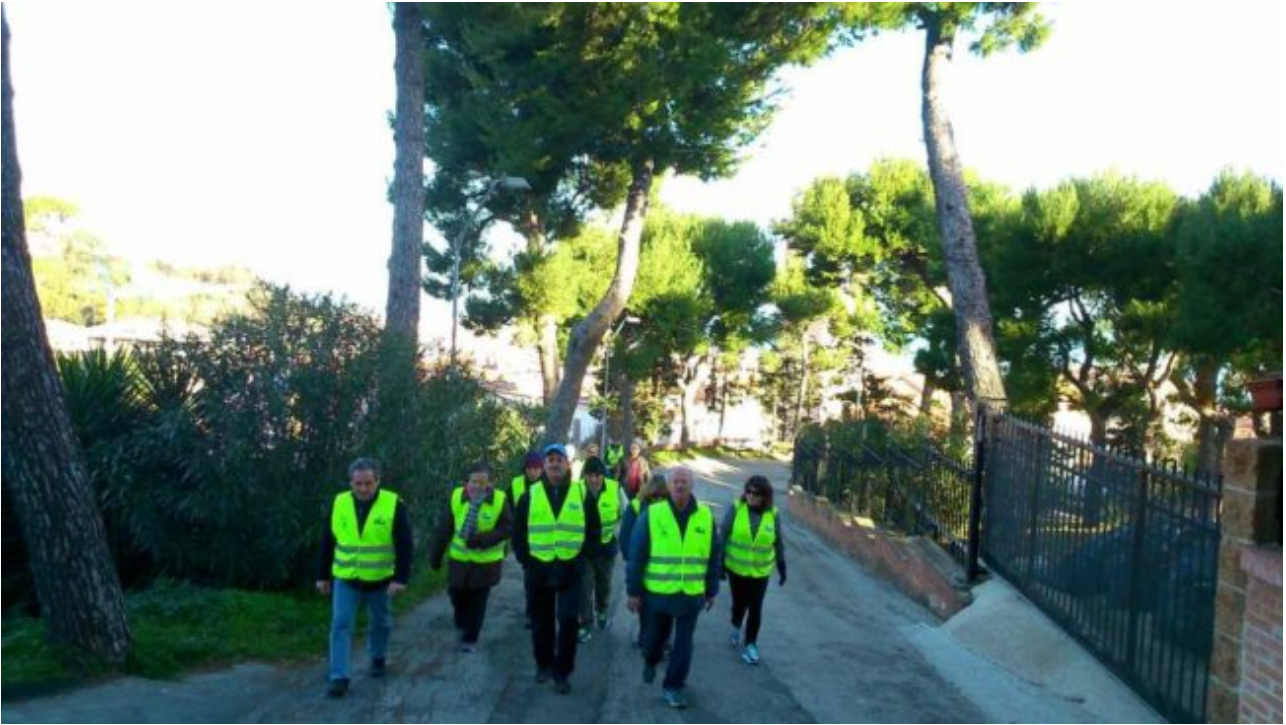
Camminata dei musei