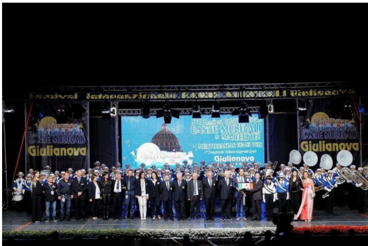
organizzatori con il Giappone

Ora si guarda già alla prossima edizione e si pensa alla strutturazione del palinsesto programmatico del festival puntando sempre alla qualità e alla varietà delle proposte.