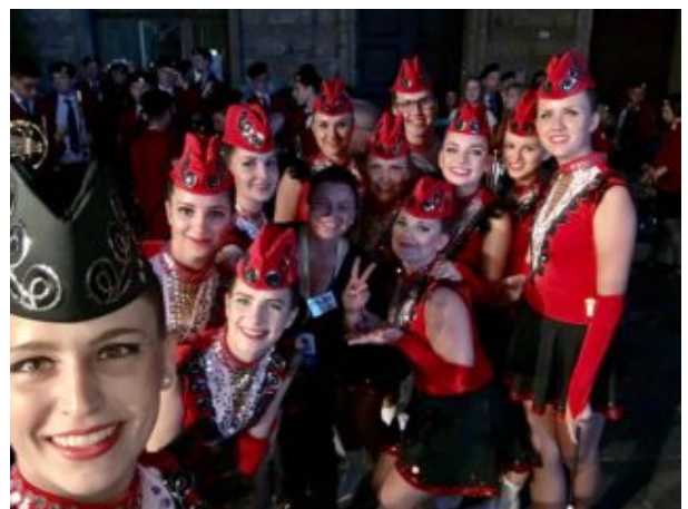
Majorettes in rosso