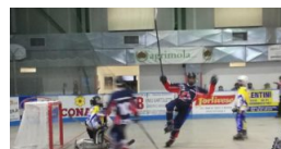
Samb Hockey inline