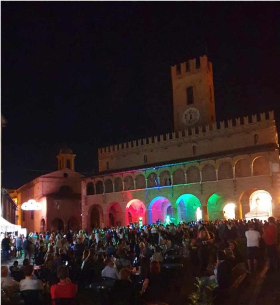
Silent Party Offida