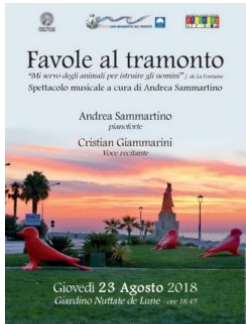
Favole al tramonto 23082018