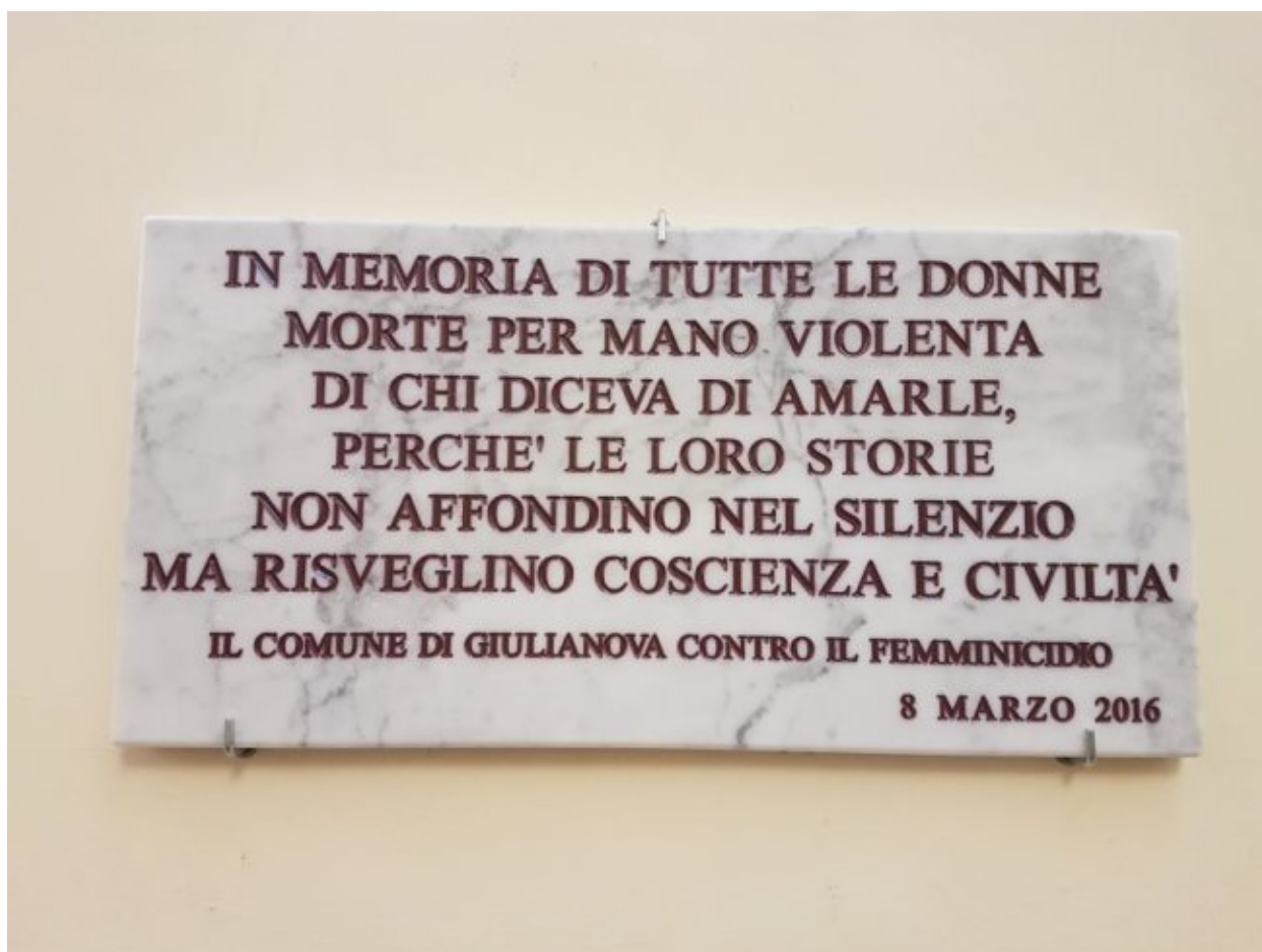
targa 8 marzo 2016 Giulianova