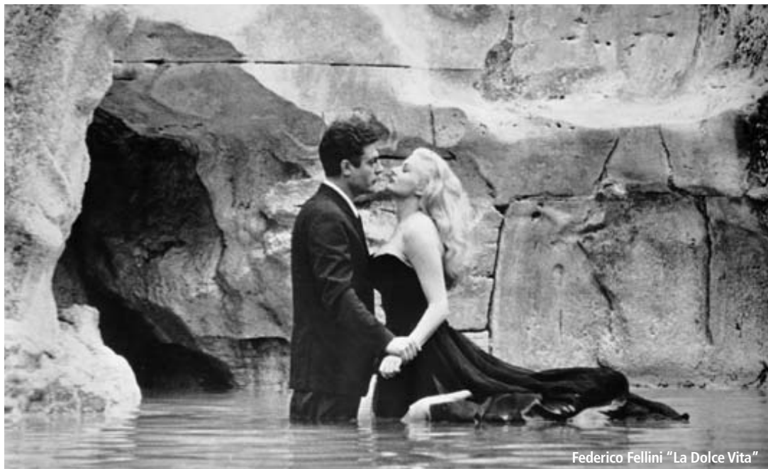
Federico Fellini "La Dolce Vita"

CONSORZIO UNIVERSITARIO PICENO SAPIENZA - UNIVERSITÀ DI ROMA - FACOLTÀ DI SOCIOLOGIA CATEDRA DI ANTROPOLOGIA CULTURALE L.UNI.D. LIBERA UNIVERSITÀ DEI DIRITTI UMANI UNIVERSITÀ DI CAMERINO FACOLTÀ DI ARCHITETTURA CORSO DI LAUREA IN DISEGNO AMBIENTALE E INDUSTRIALE DI ASCOLI PICENO UNIVERSITÀ DEGLI STUDI "CARLO BO" DI URBINO FACOLTÀ DI SOCIOLOGIA CORSO DI LAUREA IN SCIENZA DELLA COMUNICAZIONE UNIVERSITÀ POLITECNICA DELLE MARCHE FACOLTÀ DI ECONOMIA "GIORGIO FUÀ" CORSO DI LAUREA IN ECONOMIA, MERCATI E GESTIONE D'IMPRESA - SAN BENEDETTO DEL TRONTO ISTITUTO PROVINCIALE PER LA STORIA DEL MOVIMENTO DI LIBERAZIONE NELLE MARCHE E DELL'ETÀ CONTEMPORANEA CINETECA DEL COMUNE DI BOLOGNA ISTITUTO STATALE D'ARTE "O. LICINI" ASCOLI PICENO CARISAP S.P.A. DAVE PRO SAN BENEDETTO DEL TRONTO EMILCAR TELECOMPUTERS PORTO D'ASCOLI