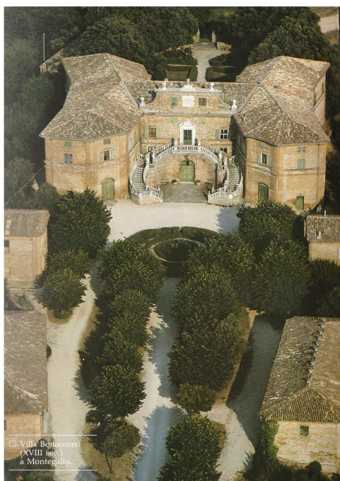
Villa Bonaccorsi (XVIII sec.) a Montegallo.

M.L. Polichetti (a cura di), Andrea Vici architetto e ingegnere idraulico. Atlante delle opere , Silvana Editoriale 2009.