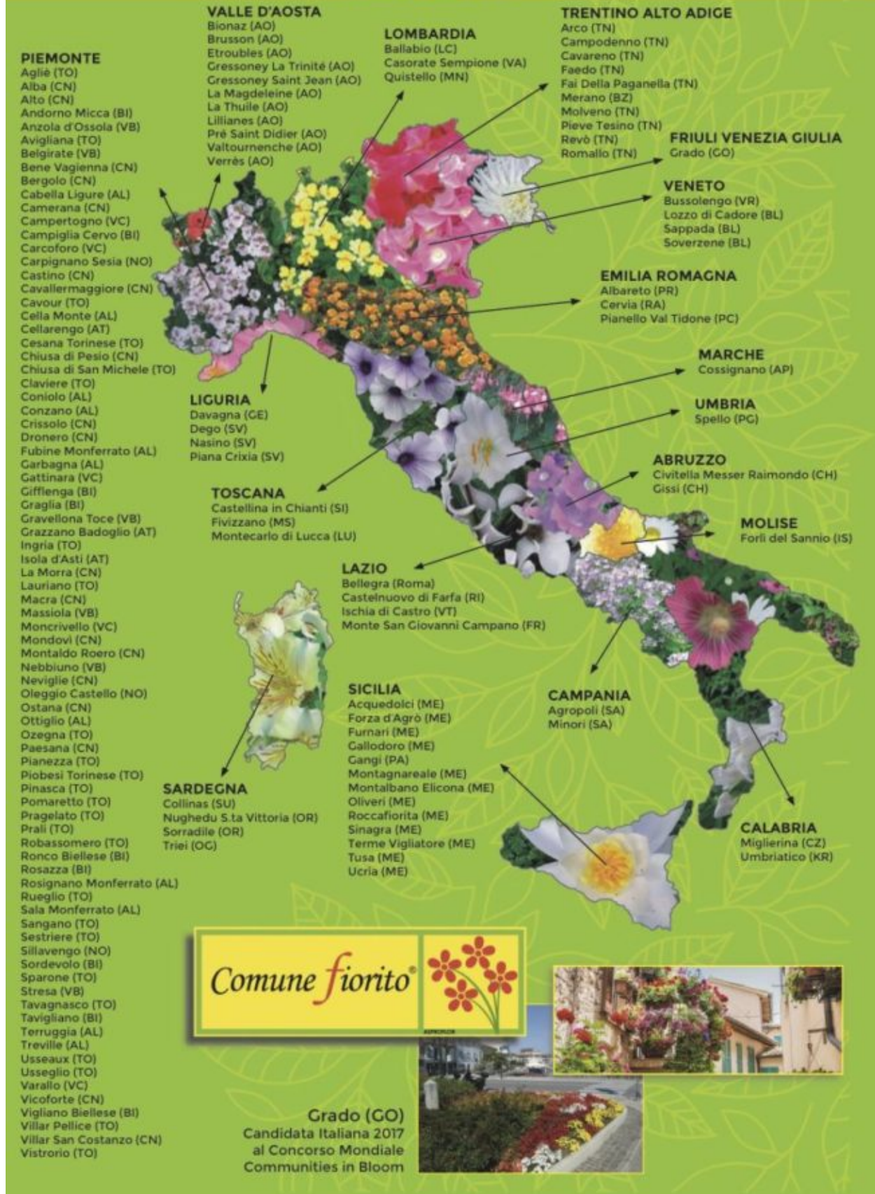
Comuni Fioriti 2017